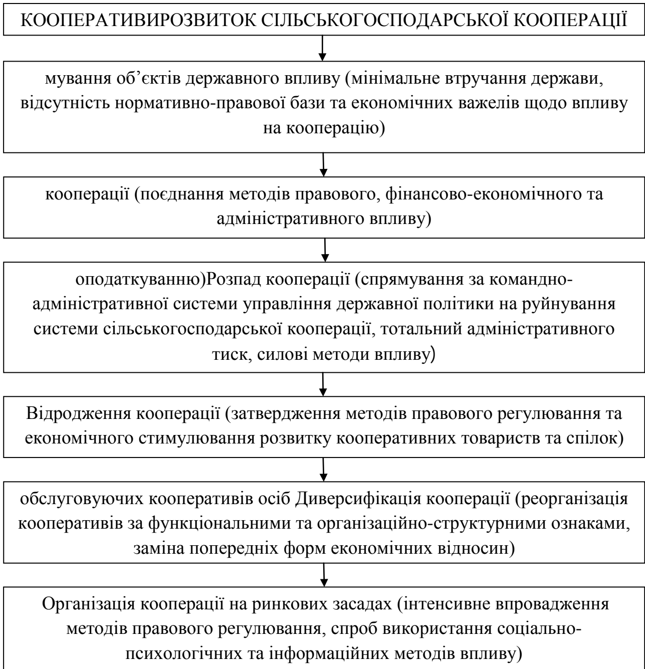
Рис. 1. Основні етапи розвитку сільськогосподарської кооперації в Україні*

Ураховуючи вищенаведений підхід нами сформовано основні етапи розвитку сільськогосподарської кооперації в Україні (рис. 1).