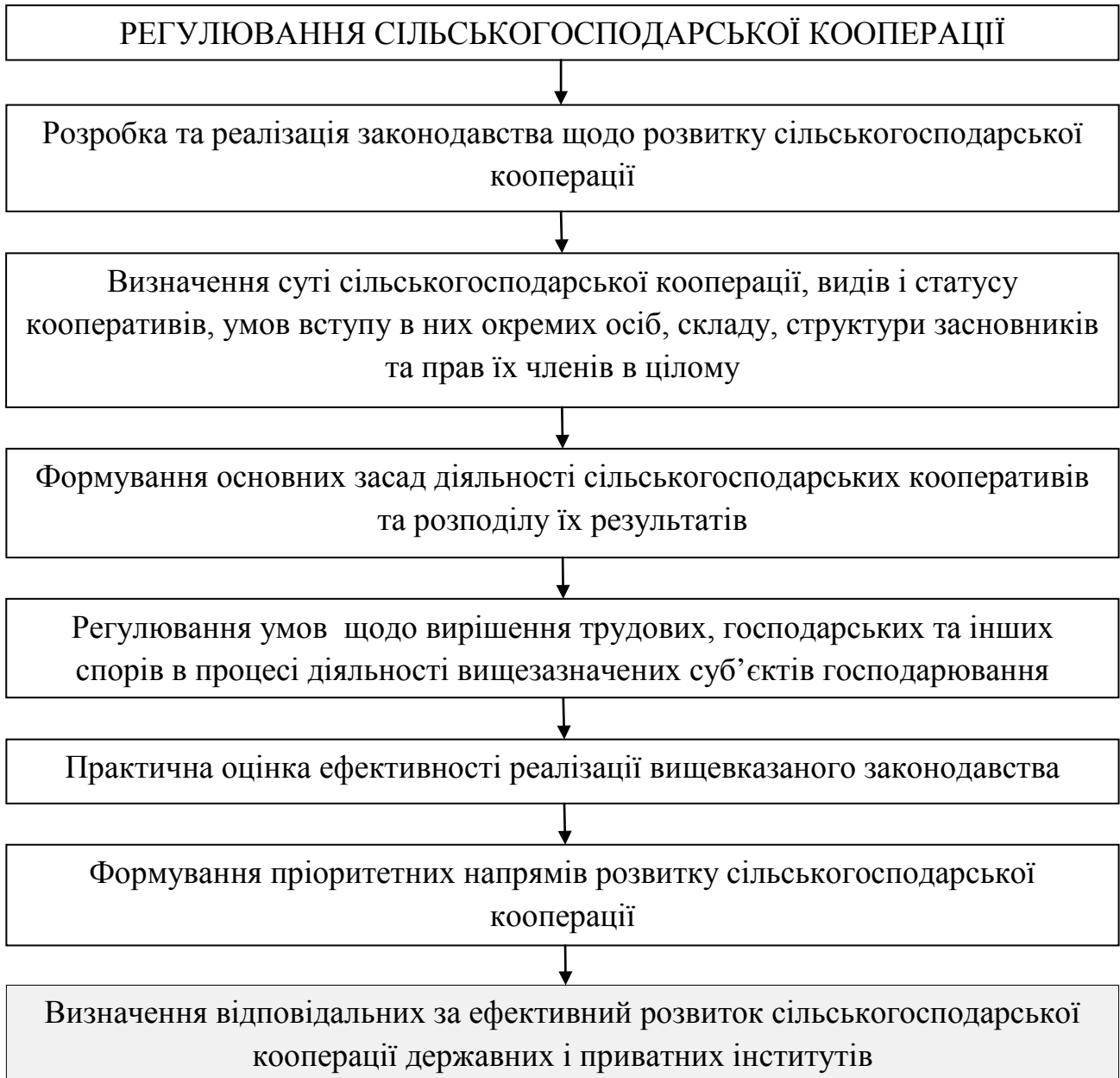
Рис. 2. Основні складові нормативно-правового забезпечення розвитку сільськогосподарської кооперації в Україні*