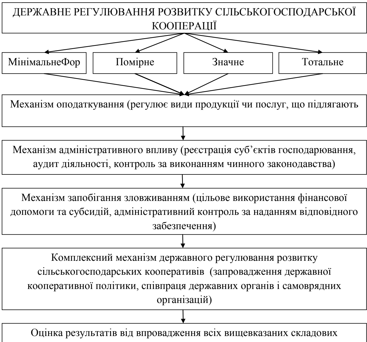
Рис. 4. Основні концептуальні напрями державного регулювання розвитку сільськогосподарської кооперації в Україні*

*Адаптовано автором підхід Я. Гаєцької-Колотило [2, с.6].